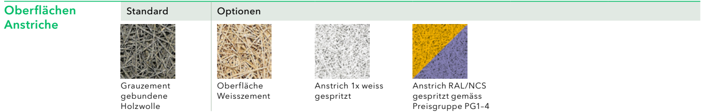
Abbildung oben: Standardversion