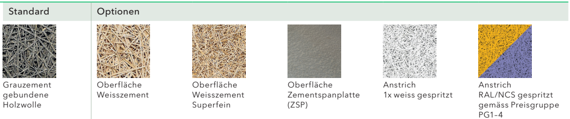
Abbildung oben: Standardversion mit Oberfläche Weisszement