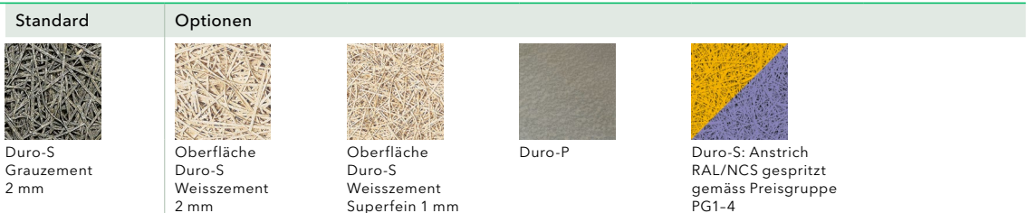
Abbildung oben: Oberfläche Duro-P