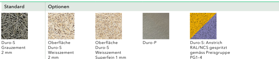
Abbildung oben: Standardversion mit Oberfläche Duro-S Weisszement