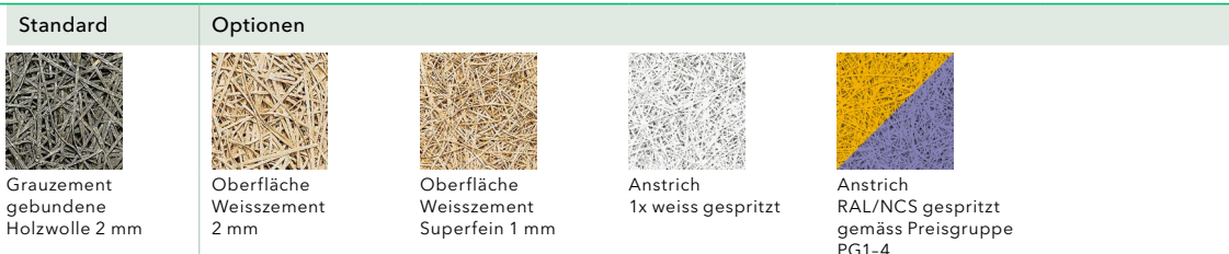
Abbildung oben: Standardversion mit Oberfläche Weisszement